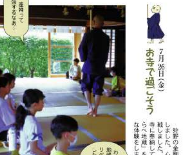
お寺で過しそろう

「おたわら子ども防災」の皆さんを講師に迎え、防災ゲーム「なますの学校」を行いました。災害が起こった時に身近にある物を使ってどう対応すれば良いか、グループで話し合いました。その後、折り紙で食器を作り、必要なものがなまは、あるもので工夫することの大切さを学びました。