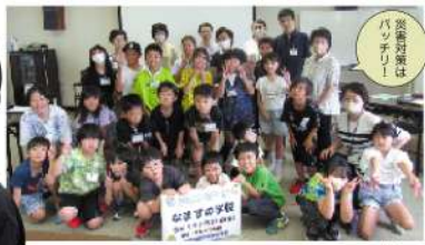
災害対策はバッチリ！