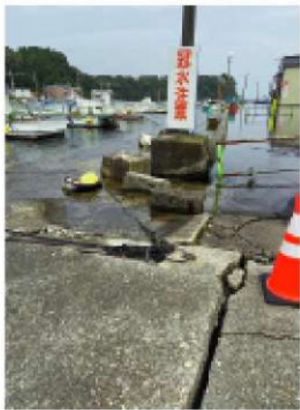
地盤沈下による海水の浸水

応援内容は、被災宅から家財やガレキの運搬廃棄などの依頼受付、現地調査です。また、毎日30名ほど専用バスで活動に来られる県外ボランティアの方々には、依頼内容を説明したり、活動結果のデータ入力なども行いました。 大きく損壊した建物は、行政による解体後に再建されますが、遠方への避難で自宅に戻れず、家財の撤去が進んでいないため、解体に着手出来ない建物が多くありました。そのため、毎日10件以上の家財撤去依頼がある状況でした。