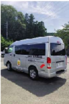
▲令和5年度は社会福祉法人 県西福祉会に送迎車両が寄贈 されました