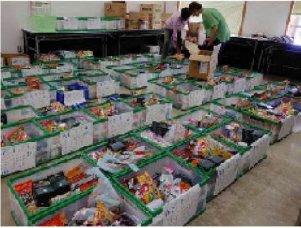
仕分け作業で大活躍のボランティアさん

これまで(令和3年3月)延べ622世帯に配布。今後も、皆さんの温かいご支援をお願いします。