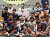
宇宙って不思議がいっぱい