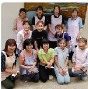
問合せ…総務企画班 73-1575

社協では、担い手養成のために昨年度から「介護職員 初任者研修」を実施しており、資格取得後、社協に勤め ると受講料のキャッシュバック制度もあります。 未経験からスタートした職員もいます。ぜひ、あなた もヘルパーとして一緒に働きませんか?