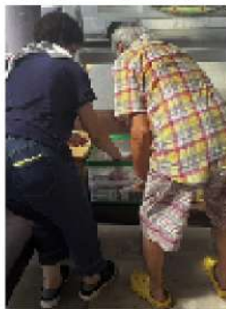
ボランティアさんと一緒に配布品を詰め替え

◆みなみのお福分け(食料配布会)で配布する食料品や日用品の寄付を常時募っています。食品の賞味期限は配布会より1か月以上先のものでお願いします。