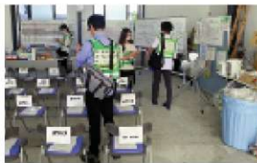
能登町災害ボランティアセンター

応援内容は、被災宅から家財やガレキの運搬廃棄などの依頼受付、現地調査です。また、毎日30名ほど専用バスで活動に来られる県外ボランティアの方々には、依頼内容を説明したり、活動結果のデータ入力なども行いました。 大きく損壊した建物は、行政による解体後に再建されますが、遠方への避難で自宅に戻れず、家財の撤去が進んでいないため、解体に着手出来ない建物が多くありました。そのため、毎日10件以上の家財撤去依頼がある状況でした。