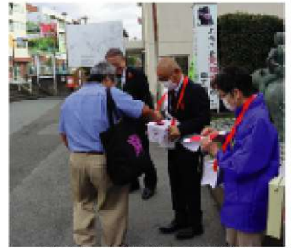
▲昨年度の大雄山駅での街頭募金