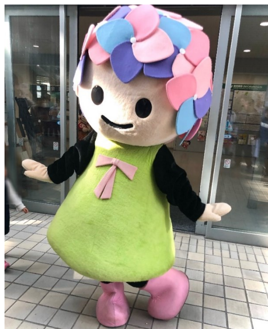
開成町マスコットキャラクター「あじさいちゃん」

ピアサポーターは同じような経験を持つ仲間（ピア）同士で自分のことを話したり、相手の話に共感しながら相談に乗ったりする活動を行っています